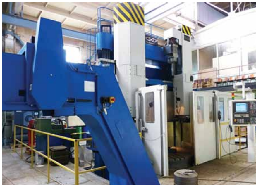
Станок карусельный двухстоечный SKD 25D