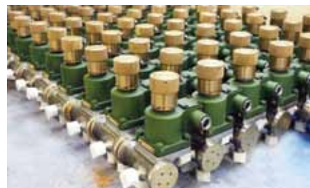
Распределитель пневматический трехходовой с электромагнитным и ручным приводом DN 3 Рр 6...55