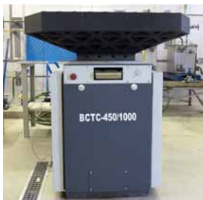
Ударная установка BCTC-450/1000 Предназначена для определения ударостойкости арматуры