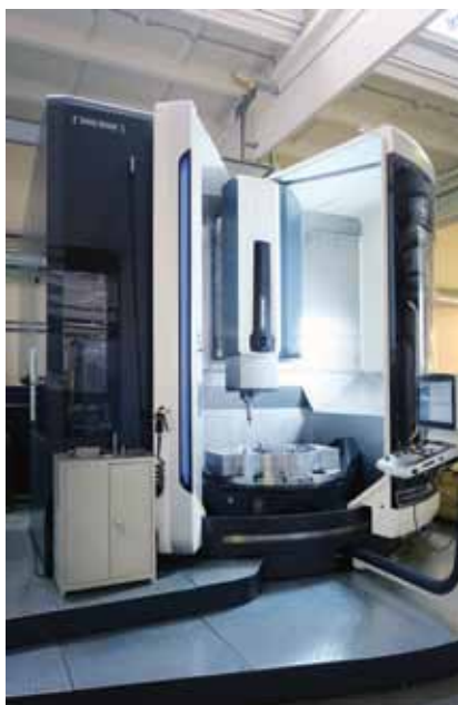
Центр обрабатывающий с ЧПУ DMU 125