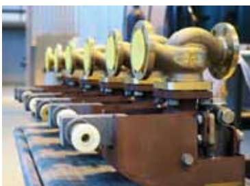
Клапан быстрозакрывающийся невозвратно-запорный проходной фланцевый DN 40, Рр 1,0 МПа