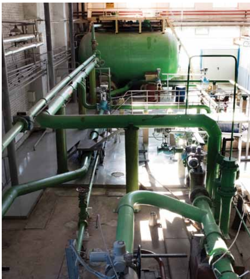
Стенд акустических испытаний по определению виброшумовых, гидродинамических и расходных характеристик судовой арматуры на проводимой среде «вода» Предназначен для определения акустических характеристик трубопроводной арматуры: уровней звукового давления, вибрации и гидродинамического шума на проводимой среде «вода»