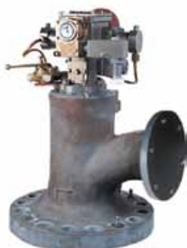
Кингстон с гидроприводом и ручным управлением фланцевый DN 200, Рр 10,0 МПа