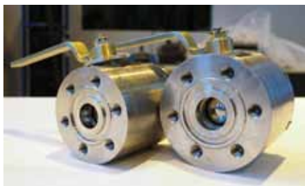
Кран запорный шаровой с ручным управлением DN 50, Рр 10 МПа