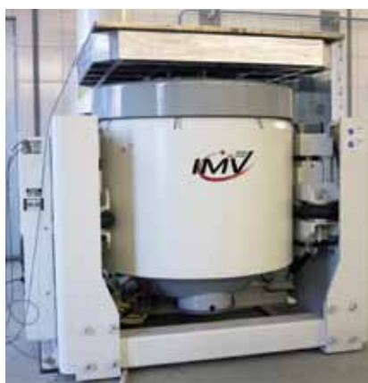
Установка испытательная вибрационная электродинамическая 1255/SA7M Предназначена для определения вибростойкости, вибропрочности трубопроводной арматуры