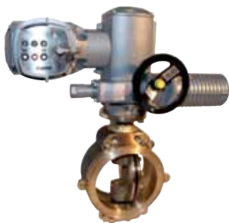
Затвор поворотный с электроприводом DN 200, Рр 6,5 – 25