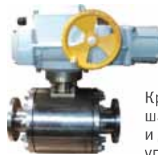
Кран регулирующий шаровой с электроприводом и дублирующим ручным управлением DN 50, PN 40