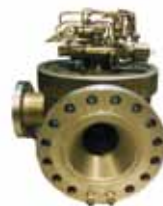
Кингстон шаровой с гидроприводом PN 40